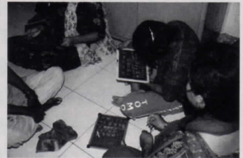
上: RF本部 下: RFでの識字教育の様子