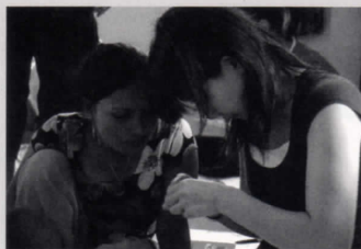
左上: 女性たちが製作したビーズ商品 左下: スタディ・ツアーでの交流の様子 上: ホスピスで暮らす女性や子どもたち